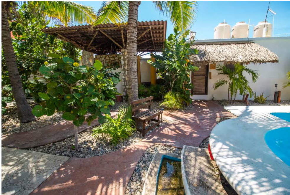
Figura 8. ARQUITECTURA ESCENIFICADA: NUEVA CONSTRUCCIÓN DE INVERSIÓN TURÍSTICA QUE SIMULA LA ESTÉTICA VERNÁCULA

Estas tres expresiones no son mutuamente excluyentes, sino que conviven, demostrando la complejidad de la hibridación cultural donde la arquitectura vernácula es simultáneamente un recurso estético, una mercancía rentable y un campo de batalla para la identidad (Ver figura 8).