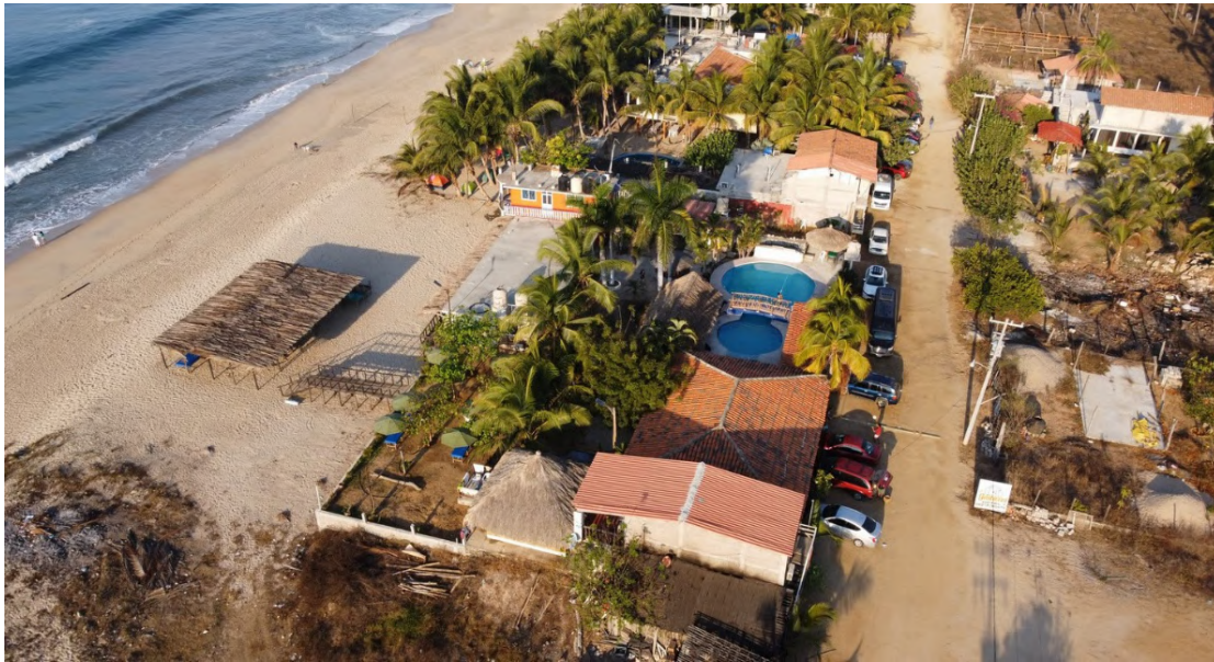
Figura 5. PROCESO DE TRANSFIGURACIÓN: VIVIENDA HÍBRIDA DE LA COSTA CHICA

permanencia que define el carácter singular de un asentamiento habitado. Ante este dilema, el estudio concluye que es imperativo diseñar estrategias de gestión y diseño urbano-arquitectónico enfocadas en la preservación de la identidad arquitectónica de la Costa Chica. Dichas estrategias deben promover una modernidad contextualizada que guíe las subdivisiones y ampliaciones de la vivienda, permitiendo su inserción rentable en el mercado turístico sin que se sacrifique el legado constructivo vernáculo.