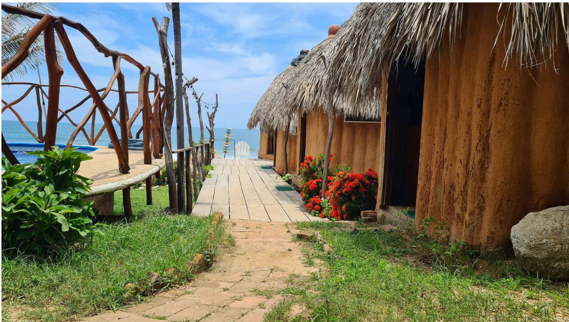
Figura 2. DETALLE DE MATERIALES CONSTRUCTIVOS TRADICIONALES: MURO DE ADOBE Y CUBIERTA DE PALMA

Además, el uso del adobe en particular, como material principal en muchas de estas construcciones, responde a una tradición milenaria de eficiencia constructiva y energética, tal como lo ha documentado Dethier (1982).