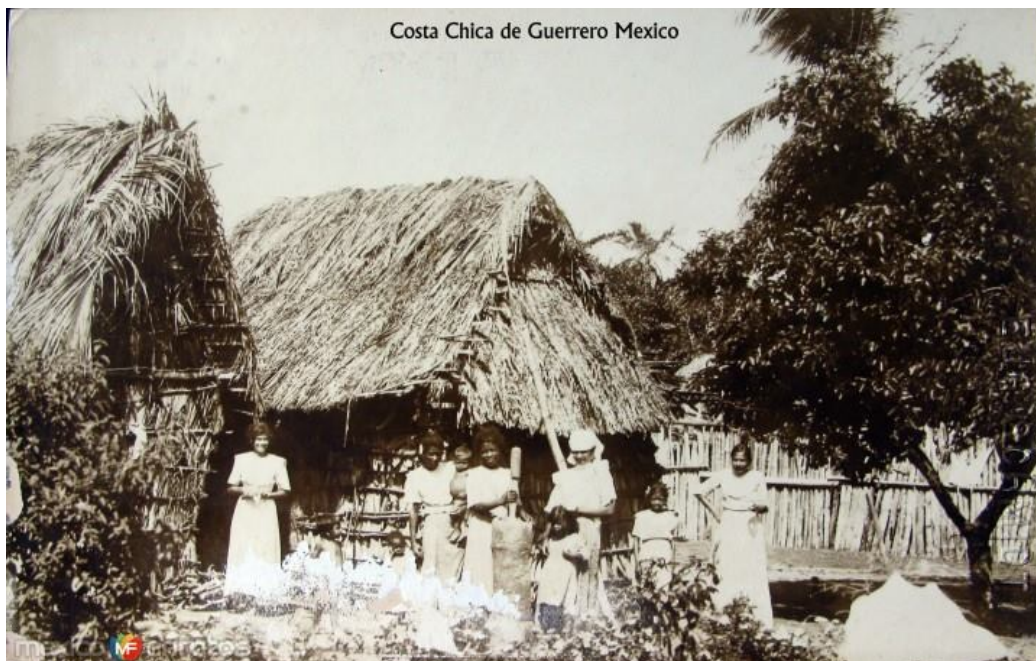
Figura 1. TIPOLOGÍA DE VIVIENDA VERNÁCULA TRADICIONAL EN LA COSTA CHICA

La Figura 1 muestra la Tipología de vivienda vernácula tradicional en la Costa Chica, ilustrando precisamente las características mencionadas: estructuras con techos de palma, muros rústicos y el entorno que refleja el modo de vida de las comunidades de la región.