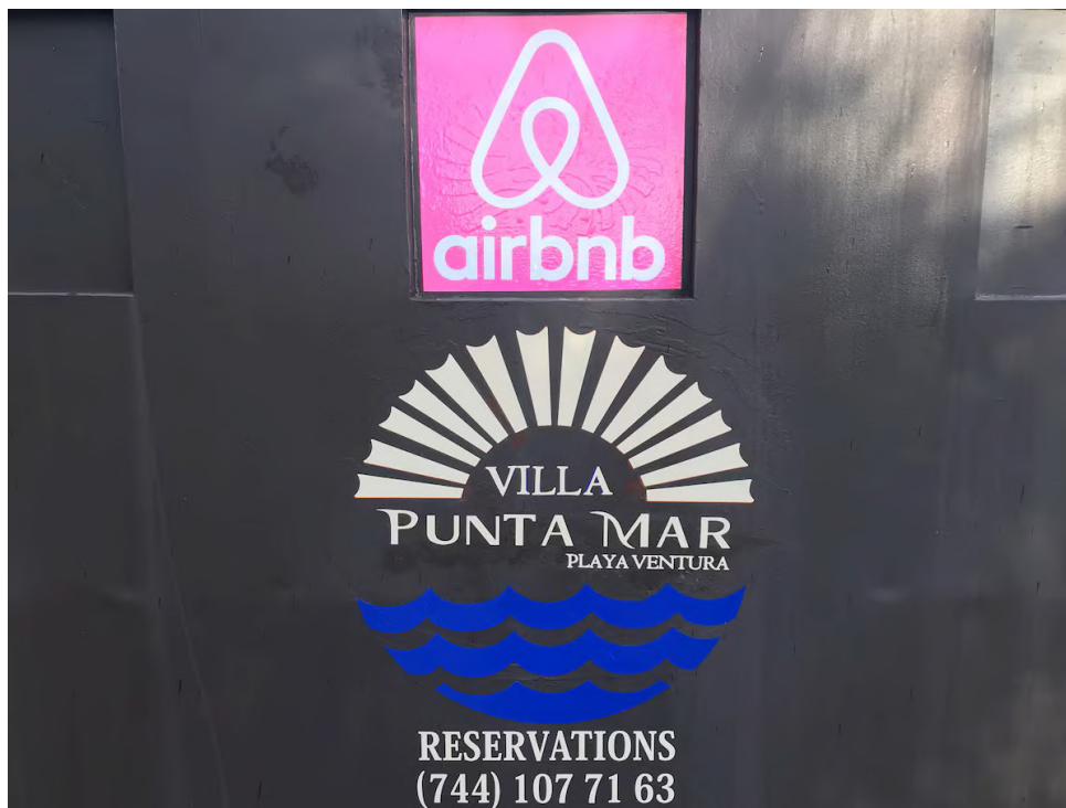
Figura 9. INTERMEDIACIÓN DIGITAL EN LA VIVIENDA TURÍSTICA RESIDENCIAL DE PLAYA VENTURA

priorizar estrategias estéticas y funcionales afines al turismo (incorporación de wifi, climatización, decoración rústica estilizada), lo que refuerza la mercantilización de la arquitectura tradicional y la construcción de una “autenticidad escenificada”. Esta dinámica, si bien ofrece una importante diversificación económica y representa una fuente de ingresos complementarios, genera nuevas tensiones sociales en la localidad: algunos pobladores celebran los ingresos y la mejora de infraestructura, mientras que otros critican la presión creciente sobre los servicios locales (agua, gestión de residuos) y la percibida pérdida de intimidad comunitaria.