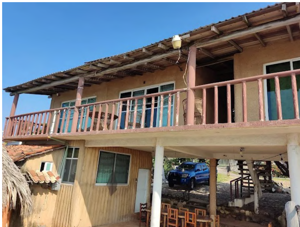
Figura 6. DETALLE DE LA HIBRIDACIÓN DE MATERIALES CONSTRUCTIVOS