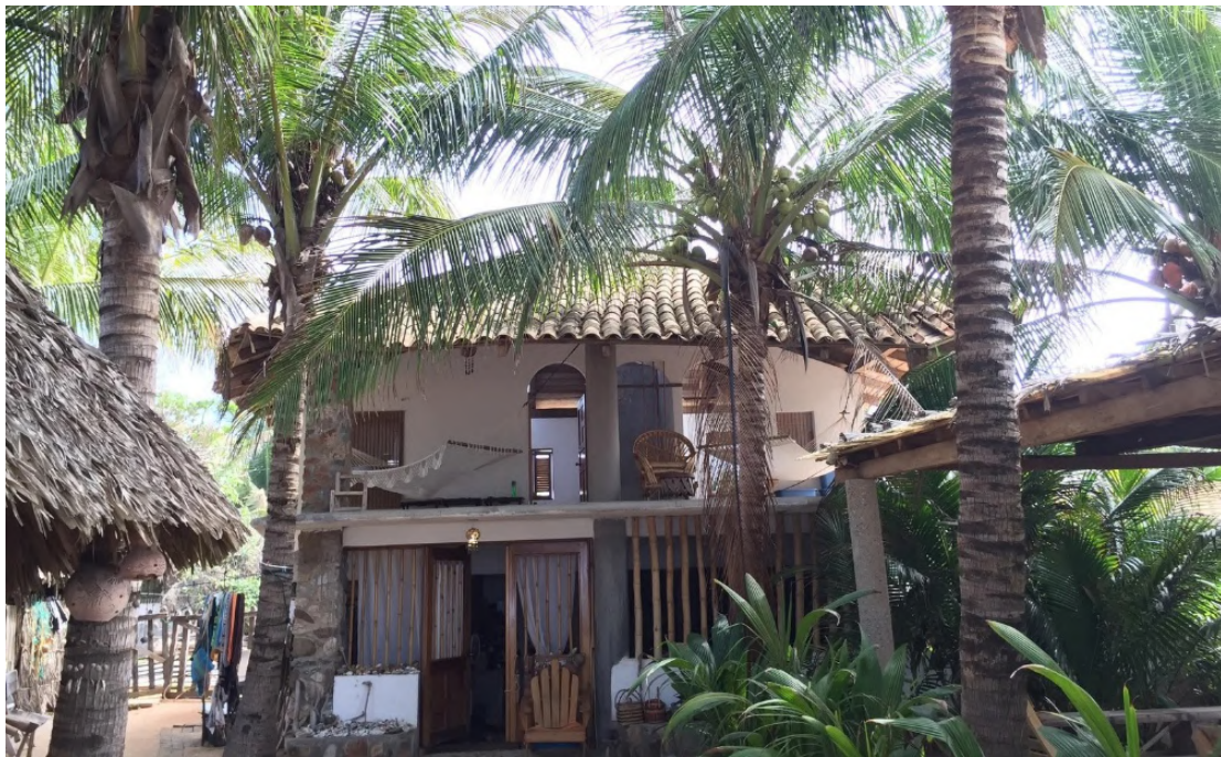
Figura 4. PROCESO DE TRANSFIGURACIÓN: VIVIENDA HÍBRIDA DE LA COSTA CHICA

Autores como Canclini (1990) han señalado que los procesos de hibridación cultural son característicos de la modernidad latinoamericana, donde lo local y lo global se entremezclan para generar nuevas formas de expresión. En el ámbito arquitectónico, esta hibridación se traduce en la coexistencia de techos de palma con baños de azulejo, de muros de adobe con ventanales de aluminio, o de patios comunitarios convertidos en áreas comunes para turistas.