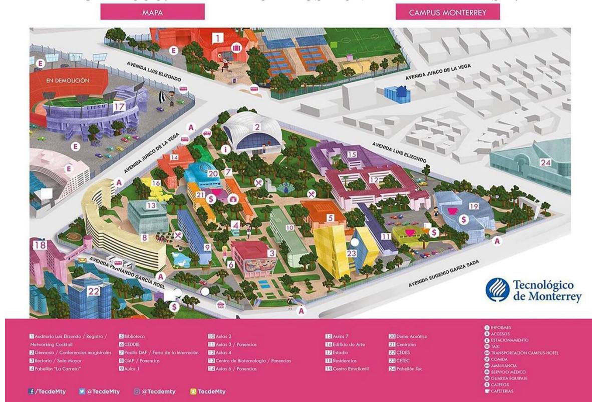
GRÁFICO 3. MAPA DEL CAMPUS MONTERREY DEL ITESM.