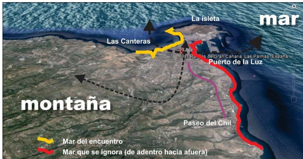
GRÁFICO 7: ESQUEMA DE LA CIUDAD DE DOS MARES, EL DEL ENCUENTRO Y EL QUE SE IGNORA.