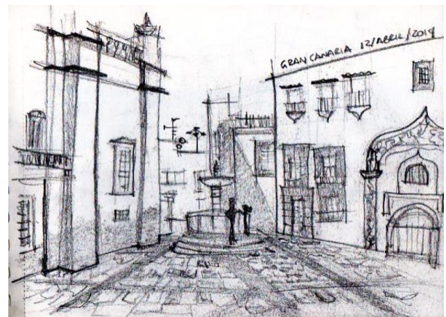
GRÁFICO 5: CROQUIS DEL PARQUE DE SAN TELMO Y BARRIO DE VEGUETA EN LA CIUDAD ANTIGUA.