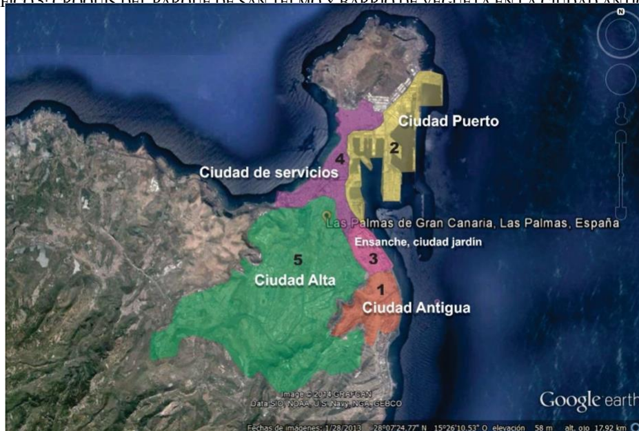
GRÁFICO 6: CONFIGURACIÓN DE LAS DISTINTAS CIUDADES EN UNA EN LAS PALMAS.

A partir de la tensión entre la Ciudad Antigua y la Ciudad Puerto se crea el ensanche de la Ciudad Jardín, y llegada la modernidad, se crea la ciudad de los servicios, finalmente la Ciudad Alta a finales del Siglo XX.