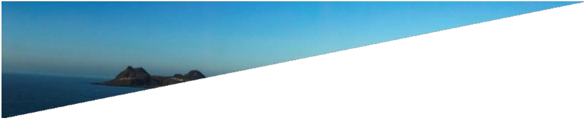
GRÁFICO 2: FOTOGRAFÍA PANORÁMICA DE LAS PALMAS DE GRAN CANARIA. Se observa su variación geomorfológica, la playa de las Canteras y la Isleta en el extremo izquierdo.

Esta ciudad ha pasado por una serie de transformaciones, pero hay un cambio fundamental, el que marcó su historia: su propio mito, convirtió su entorno adverso en la leyenda de las Islas Afortunadas. Los restos arqueológicos encontrados en la isla, hablan de las dificultades que la población originaria tuvo para sobrevivir a todo lo que se oponía a ella: clima, escases de recursos, aislamiento. Dice el periodista y escritor José A. Alemán que Las Palmas es la representación de la idea Tour de forcé , que quiere decir, un pueblo que se sobrepone a las condiciones adversas para sobrevivir (Alemán, 2013). Sin embargo, en la mitología europea y árabe, se conoce a las Islas Canarias como las Afortunadas, las del Jardín de las Delicias.