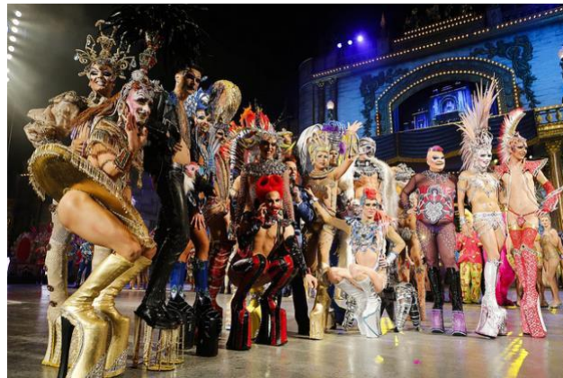
GRAFICO 4: GALA DRAG EN EL CARNAVAL DE LAS PALMAS DE GRAN CANARIA.

Conservadurismo en celebración de la diversidad: Las Palmas y la isla de Gran Canaria en general, son un entorno de diversidad sexual. Existen varios bares, tiendas y espacios dedicados a la comunidad LGBTTTTIQA+. La fiesta del orgullo Gay y el Carnaval de Las Palmas con su Gala Drag, son los principales ejemplos. En este contexto, es un lugar donde la comunidad de la diversidad sexual hace suyas las calles, las playas, los bares, en la madrugada, la tarde y a la luz del día, sabiendo que la ciudad es suya, como de todas y todos. Aunque, a decir verdad, es solo en esta temporada, ya que en la vida cotidiana persiste aun en el siglo XXI, discriminación hacia estos grupos.