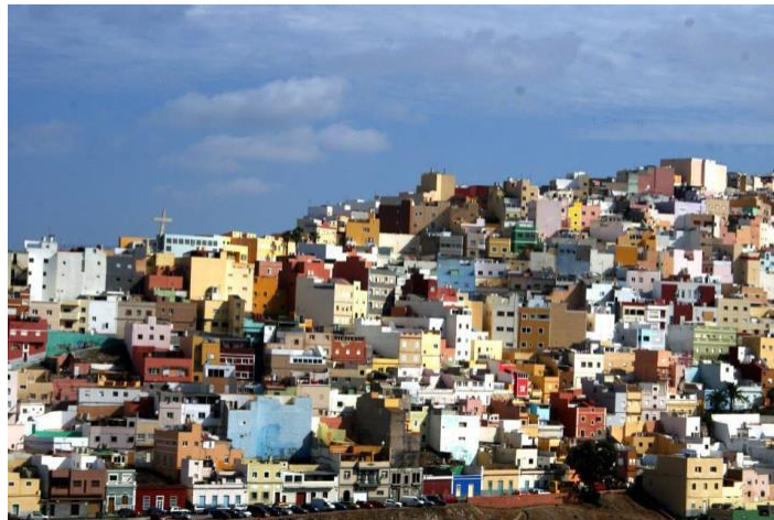
GRAFICO 3: LOS RISCOS EN LA CIUDAD ANTIGUA DE LAS PALMAS.