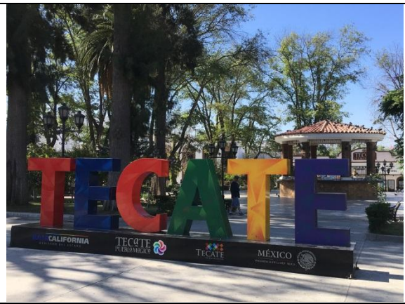
Posicionamiento de la marca de Tecate Pueblo Mágico