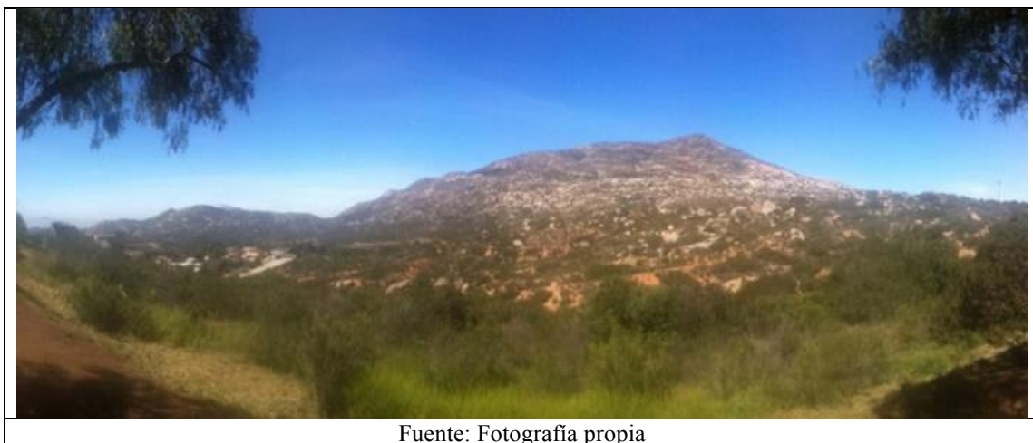
FIG. 2 PANORÁMICA DEL CERRO CUCHUMÁ DESDE EL PARQUE DEL PROFESOR, TECATE, BAJA CALIFORNIA

Estos atractivos paisajísticos y patrimoniales fueron considerados para otorgar la distinción a Tecate en conjunto con otros elementos intangibles; pero como se comentó anteriormente, se ha cuestionado su relevancia en comparación con los otros pueblos mágicos considerados en el programa, en particular por la cantidad de los bienes patrimoniales que en conjunto no logran conformar un centro histórico como tal, pues se trata de elementos aislados, cuyo origen es de poco más de sesenta años. En contraste, el elemento paisajístico más importante y cercano a la localidad, el cerro Cuchumá (Ver Fig. 2), que incluso es el que hace las veces de “telón de fondo” de la ciudad, está claramente posicionado en el imaginario colectivo como un lugar especial, importante para la cultura kumiai originaria de estos territorios, a los pies del cual se encuentra el mencionado Rancho La Puerta, que promueve el contacto y respeto a la naturaleza, tanto para sus visitantes como entre la población local de Tecate.