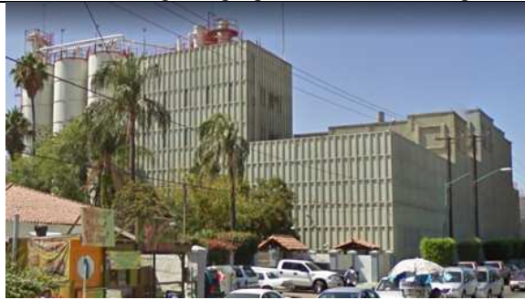
Vista Cervecería Tecate antes de la ampliación