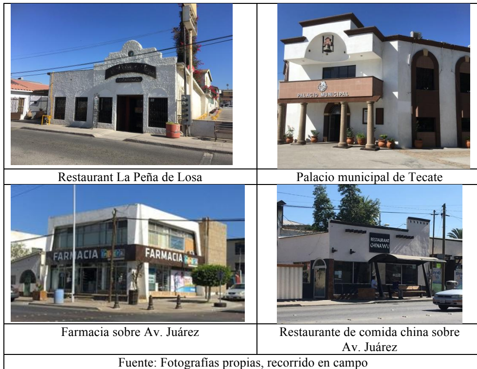
FIG. 3. TRANSFORMACIÓN DE LA IMAGEN URBANA EN EL CENTRO TRADICIONAL DE TECATE. SE HOMOGENEIZÓ EL USO DEL COLOR EN LOS EDIFICIOS DEL CENTRO, INDEPENDIEMENTE DE SUS FORMAS Y USOS, DANDO POR RESULTADO UN ESCENARIO CREADO EN EL CENTRO TRADICIONAL.

Se realizaron también las obras de rehabilitación del Parque Miguel Hidalgo, el centro de reunión más importante para la población de Tecate. Lo más notable de estos trabajos fue el cierre de un tramo de la calle Lázaro Cárdenas en el lado oeste del parque, desarrollando un pasaje peatonal que incluyó bancas y la plantación de palmeras. Este espacio peatonal ha servido como área abierta que ha permitido la celebración de eventos como exposiciones, ferias, conciertos y otras festividades que se realizan eventualmente y, a pesar de que hubo algunas manifestaciones en contra del cierre de esta vialidad, la población se ha apropiado de este espacio a partir de la socialización, simbolización e identificación que han desarrollado en y hacia el lugar. Asimismo dentro del Parque Hidalgo destaca la restauración del quiosco y la fuente como elementos de valor histórico, además, se incorporó mobiliario urbano, como bancas, botes de basura e iluminación, otras obras fueron la construcción de banquetas además del mantenimiento de árboles y vegetación existente. En relación a estas obras de infraestructura se puede mencionar que si bien han mejorado las condiciones de su estado físico y contribuido a embellecer este espacio central de la ciudad, estos trabajos se han limitado al primer cuadro de la ciudad, lo cual no se ha traducido en un beneficio directo al resto de la población que continúa con carencias en infraestructura.