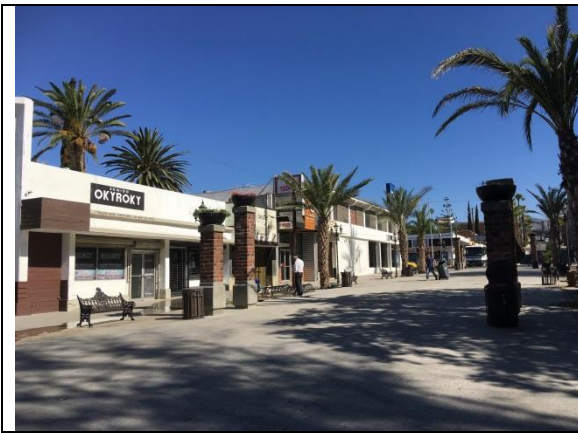
Espacio peatonal antes Av. Lázaro Cárdenas

Otra de las alteraciones al patrimonio con el que cuenta Tecate, son las intervenciones en la Parroquia de Nuestra Señora de Guadalupe, a la que se le modificó la Torre del campanario y la fachada, modificando la forma y proporciones originales con la finalidad de coincidir con la lógica “colonial”, a pesar de que ésta resulte exógena a las manifestaciones arquitectónicas locales, mismas que alteran la imaginabilidad urbana 2 del lugar (Lynch, 2012).