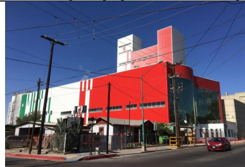
Nuevo edificio de la Cervecería Tecate.