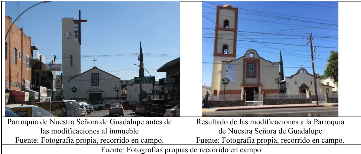
FIG. 4. TRANSFORMACIÓN DE LA IMAGEN URBANA EN EL CENTRO TRADICIONAL DE TECATE

Algunos aspectos positivos que han derivado del programa son la construcción del Museo Comunitario Kumiai y el registro del Centro Estatal de las Artes Tecate (CEART), en la Red de Centros del Consejo Nacional para la Cultura y las Artes (CONACULTA) en el año 2014. Este último destaca en su labor de difundir y promover actividades que se ligan al impulso del pueblo mágico y de la conservación de sus tradiciones, así como de la cultura en general.