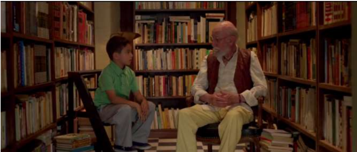
FOTOGRAMA 9, EL JEREMÍAS, 2016

Comenzamos con la biblioteca ( FOTOGRAMA 9 ). Este edificio es donde Jeremías conoce a Felipe, su primer amigo; Felipe es además el primero que nota el genio de nuestro protagonista y quien lo incita en actividades que inciten su intelecto como el ajedrez. Entonces, Felipe se convierte en la primera fuente de conocimiento y amistad real de Jeremías ¿qué es el espacio? Una biblioteca, llena de libros en estantes y un piso como tablero de ajedrez