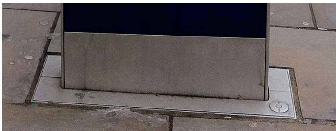
FIGURA 2: SÍMBOLO HORIZONTAL QUE SEÑALA EL NORTE, SITUADO EN LA BASE DEL PANEL.

Aunque la orientación del panel se vincula al eje de la calle, existe una referencia en la base del mismo a las orientaciones cartesianas, mediante un símbolo horizontal que señala al Norte (ver Figura 2).