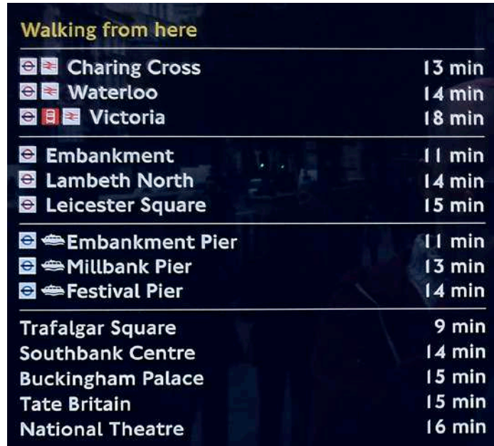
FIGURA 5: DISTANCIAS ANDANDO.

Se emplean flechas para indicar de forma clara la dirección a seguir, de esta manera, los viandantes que se dirijan a estos puntos o sus cercanías, no necesitan pararse a mirar toda la información del panel (ver Figura 4).