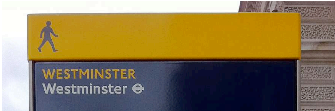
FIGURA 3: EXTREMO SUPERIOR Y TÍTULO DEL PANEL.