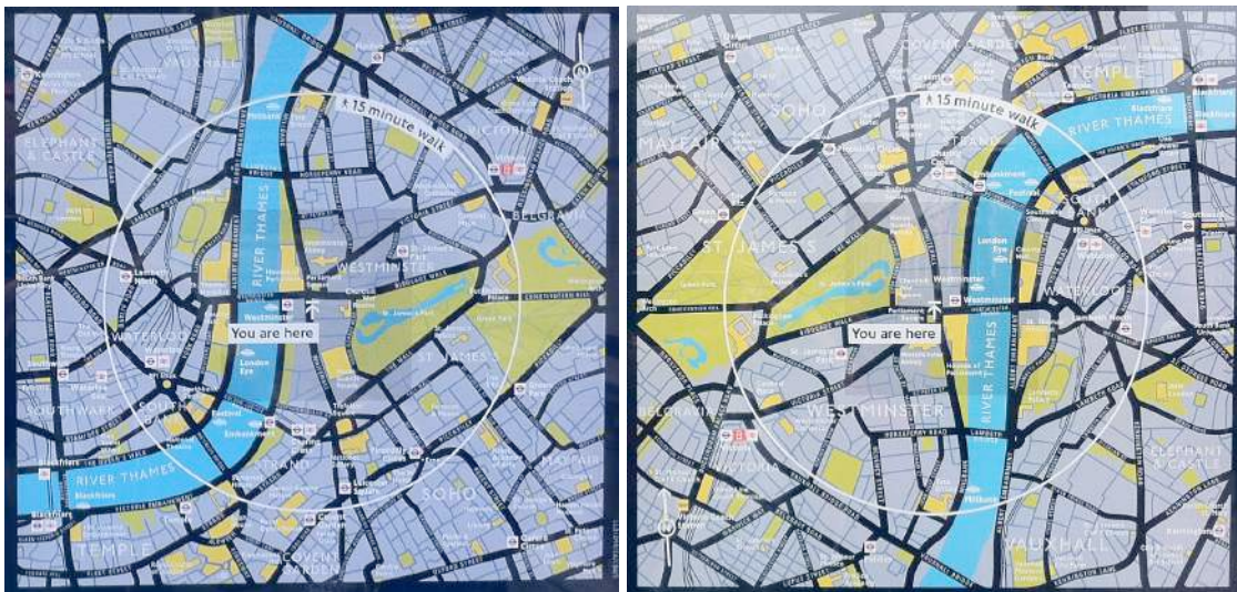
FIGURA 6: MAPAS DE 15 MINUTOS SITUADOS POR AMBAS CARAS DE UN MISMO PANEL.

En los Monolith, se incorpora una tabla con las distancias estimadas en minutos desde el panel a los puntos cercanos de interés: paradas de metro, tren y barco, y a las plazas y edificios singulares. De esta forma se anima a los peatones a realizar estos desplazamientos andando, en lugar de emplear los medios de transporte en recorridos cortos (ver Figura 5).