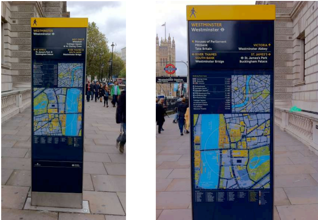
FIGURA 1: EJEMPLO DE PANEL DE INFORMACIÓN TURÍSTICA FOTOGRAFIADO POR AMBAS CARAS.