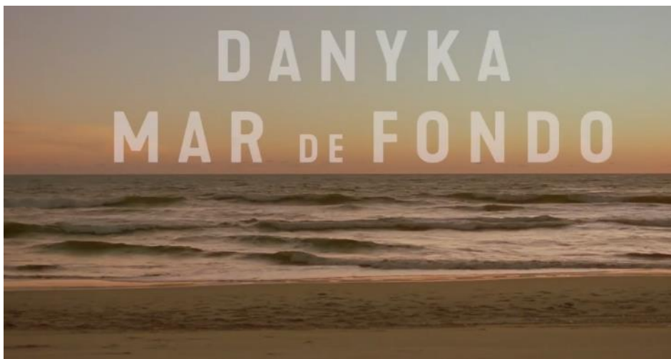
Figura 6. EL SEXTO ESCENARIO ES EL MAR VISTO DESDE LA PLAYA DE NUEVO ALTATA

Fuente: Película Danyka: Mar de Fondo , 26/12/2020.