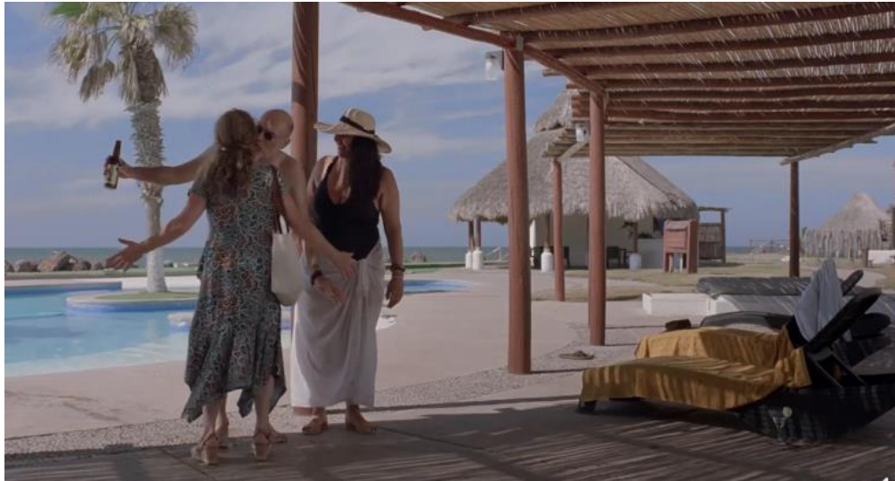
Figura 2. EL SEGUNDO ESCENARIO REPRESENTA LOS ESPACIOS TURÍSTICOS DISEÑADOS PARA EL ATRACTIVO TURÍSTICO EN LA PLAYA DE NUEVO ALTATA