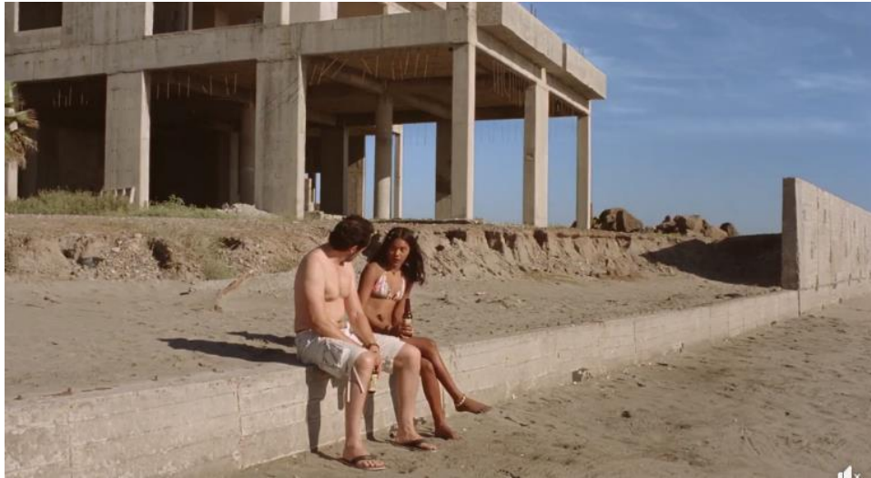
Figura 5. EL QUINTO ESCENARIO ES UN ESPACIO TURÍSTICO RESIDUAL CONSIDERADO UN ESCENARIO TRASERO DEL CONJUNTO TURÍSTICO EN LA PLAYA DE NUEVO ALTATA

Fuente: Película Danyka: Mar de Fondo , 26/12/2020.