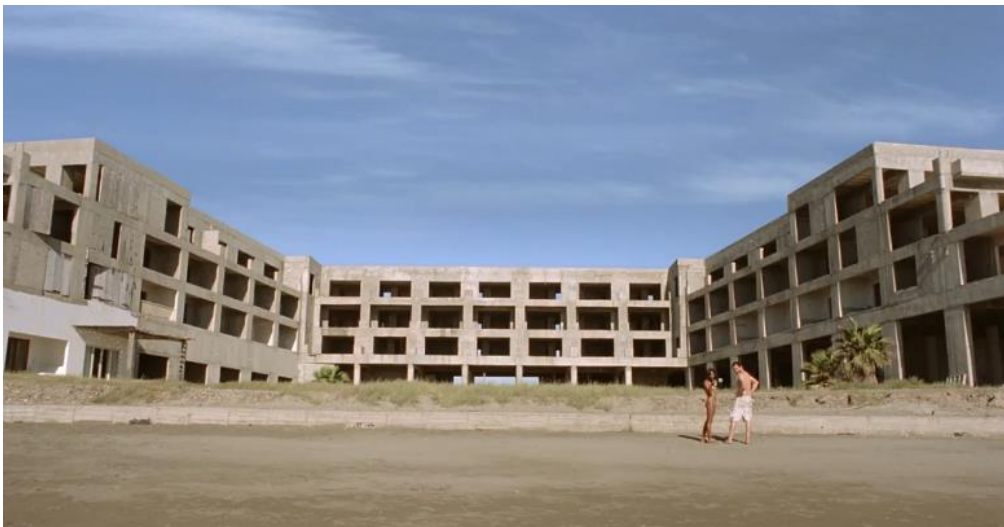
Figura 4. EL CUARTO ESCENARIO ES UN ESPACIO TURÍSTICO INCONCLUSO DEL CONJUNTO TURÍSTICO EN LA PLAYA DE NUEVO ALTATA