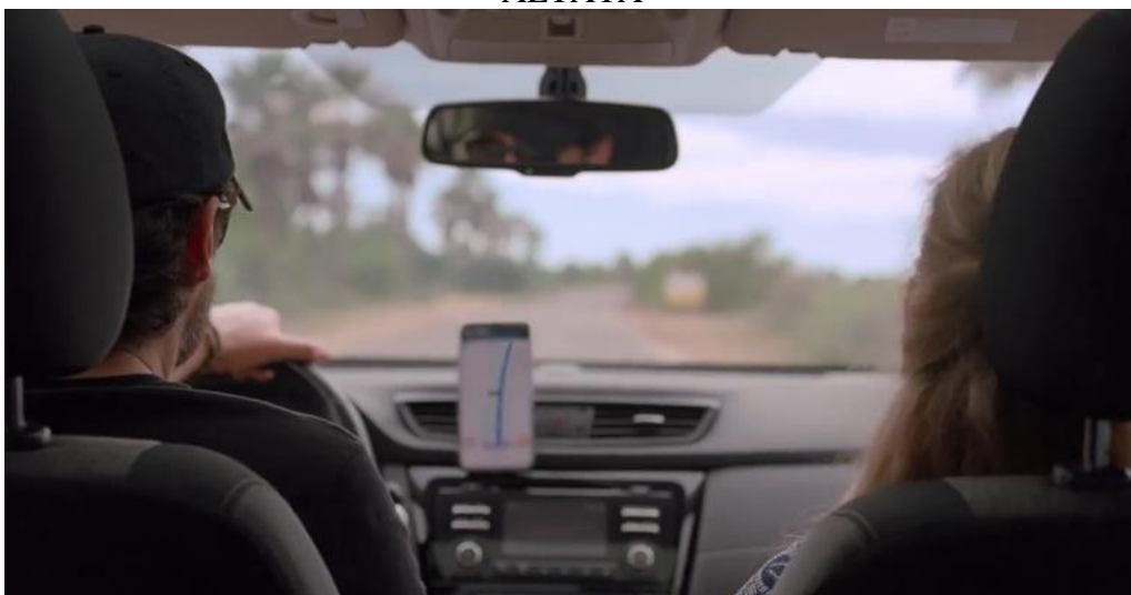
Figura 1. EL PRIMER ESCENARIO REPRESENTA UN PAISAJE TURÍSTICO CAPTURADO CON UN FONDO NEBULOSO DE UN CAMINO A LA PLAYA DE ALTATA