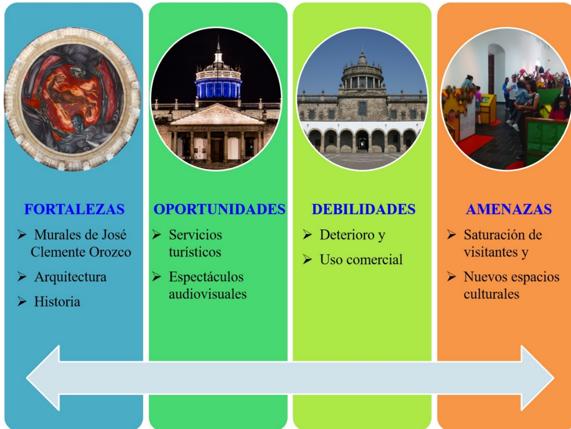
FIGURA 2. ANÁLISIS FODA DEL ICC

Los subproductos del turismo experiencial de este centro cultural son: el museo, actividades culturales a través de conciertos, espectáculos audiovisuales y visitas guiadas. Este centro histórico es el más notable en el estado de Jalisco con gran influencia sobre la vida económica, social, cultural y científica de Guadalajara; a continuación se presenta la síntesis del análisis FODA practicado a cada uno de los monumentos histórico-culturales que integran al CHG pero, particularmente el respectivo al Instituto Cultural Cabañas (ICC) como se puede observar en la siguiente figura.