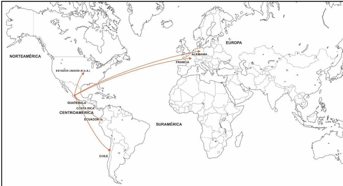
FIGURA 3. VISITANTES EXTRANJEROS EN EL CHG 2014-2016

Fuente: Secretaría de Turismo del Estado de Jalisco, 2015.